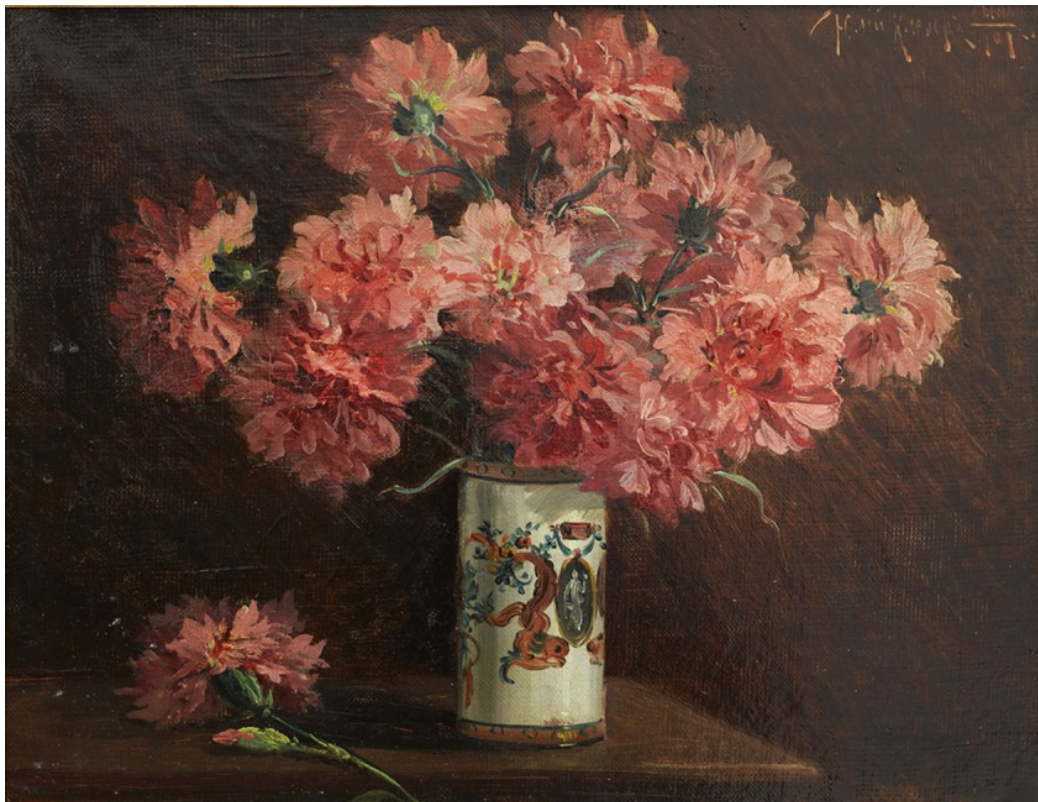
Ю.Ю. Клевер. Натюрморт с гвоздиками. 1920-е годы.

Иногда садовник срезал мне несколько левкоев или махровых гвоздик. Я стеснялся везти их через голодную и озабоченную Москву и потому всегда заворачивал в бумагу очень тщательно и так хитро, чтобы нельзя было догадаться, что в пакете у меня цветы.